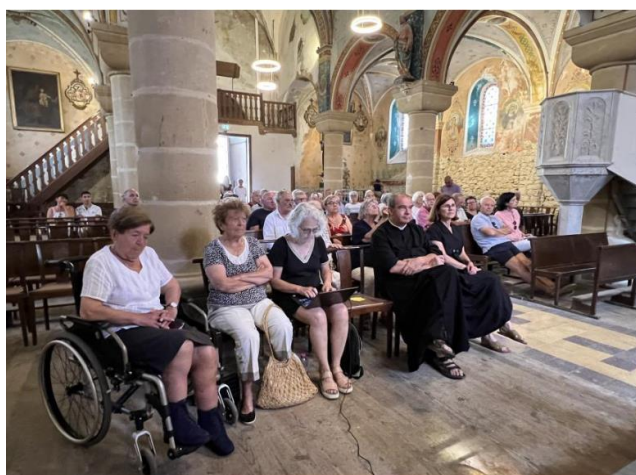
Réception des travaux 19 aout 2023

Pour nous contacter : (adhésions, dons, collecte d'objets pour vide grenier, etc....) :